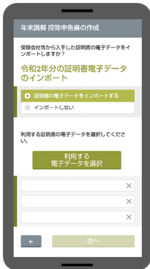
B マイナポータル連携画面